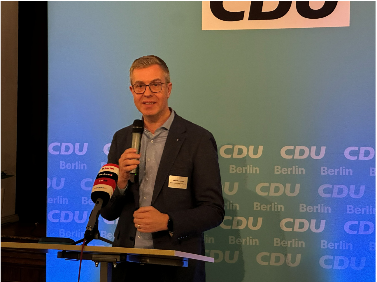
Stefan Evers, Bürgermeister und Senator für Finanzen des Landes Berlin

Politiker erinnerte daran, dass der Staat handlungsfähig ist, wenn alle an einem Strang ziehen. Ob die reibungslose Silvesternacht oder das Krisenmanagement nach dem Stromausfall im Südwesten: Berlin funktioniere im entscheidenden Moment. Evers' Plädoyer: Gemeinsame Werte und Tatkraft sind die beste Antwort auf politische Ränder.