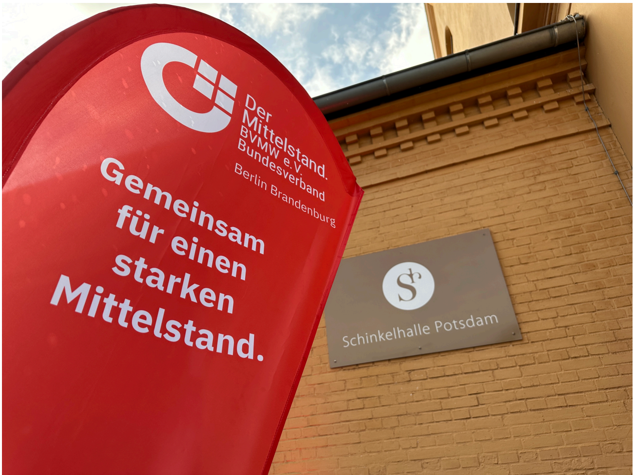
Tradition und Innovation: Die Schinkelhalle in Potsdam | BERLINboxx