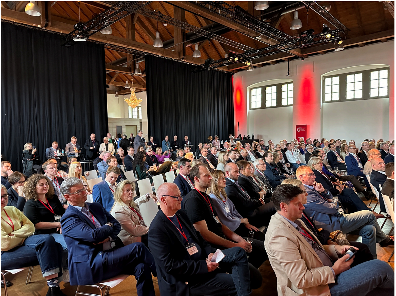
Rund 200 Gäste aus Politik, Wirtschaft und Gesellschaft sind der BVMW-Einladung nach Potsdam gefolgt